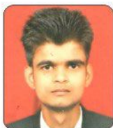
Shubhanshu Country Inn Suits