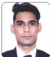
Rohit Sharma IGI-Airport