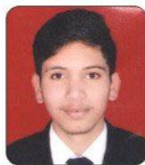
Amrit Pal Country Inn Suits