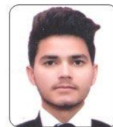
Meraj Country Inn Suits