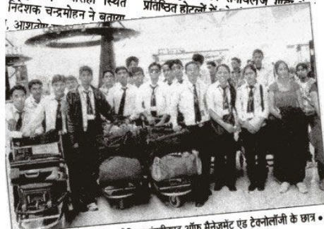
एक्सपोजर फ्लाइट देख लोटे इम्पीरियल इंस्टीट्यूट ऑफ मैनेजमेंट एंड टेक्नोलॉजी के छात्र •