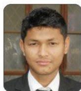
Omprakash The Fern Ahmedabad