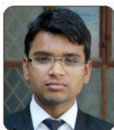
Sonu Soni Vivanta by Taj Lucknow