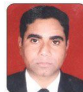
Khem Singh Country Inn Suits