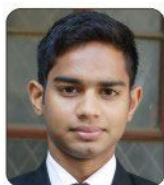
Shiva Gola Air India, IGI Delhi