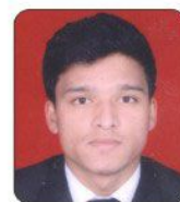
Manoj Kumar Country Inn Suits (Delhi)