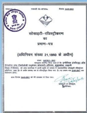
Govt. of Uttarakhand Registration Certificate