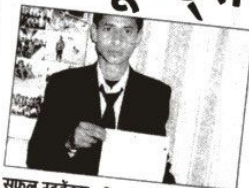
लेटर दिखाते इंपीरियल इंस्टीट्यूट के सफल स्टूडेंट्स •