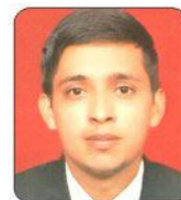
Shantanu Country Inn Suits