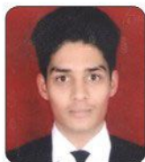
Bhupender Bora Country Inn Suits