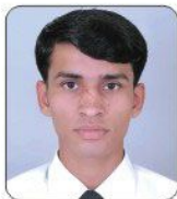
Kuldeep Club Mahindra, Naukuchiatl