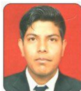
Sharad Country Inn Suits